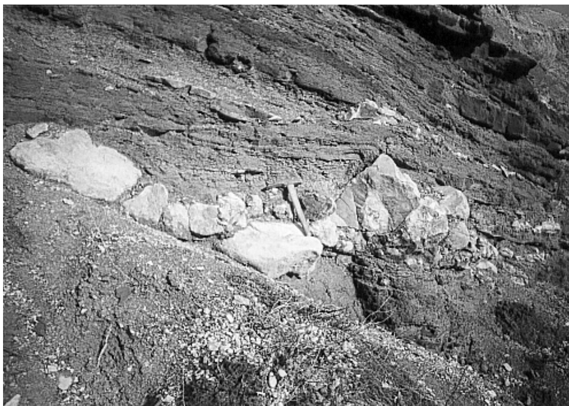
Рис. 2 – Конгломератовая толща в глинистых алевролитах. Нижняя граница резкая, дугообразной формы, с углублением вмещающих пород. Обнажение в нижней части Старого Балаклавского карьера

Форма обломочного материала: не окатанная □ слабо окатанная ◊ хорошо окатанная △